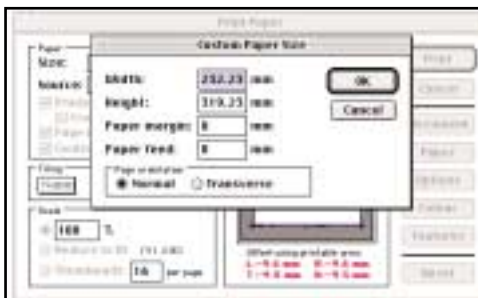
Figura3a e 3b