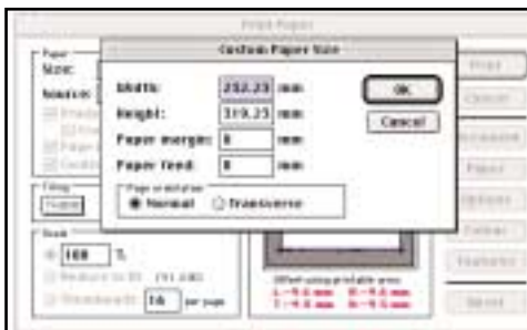
Figura3a e 3b